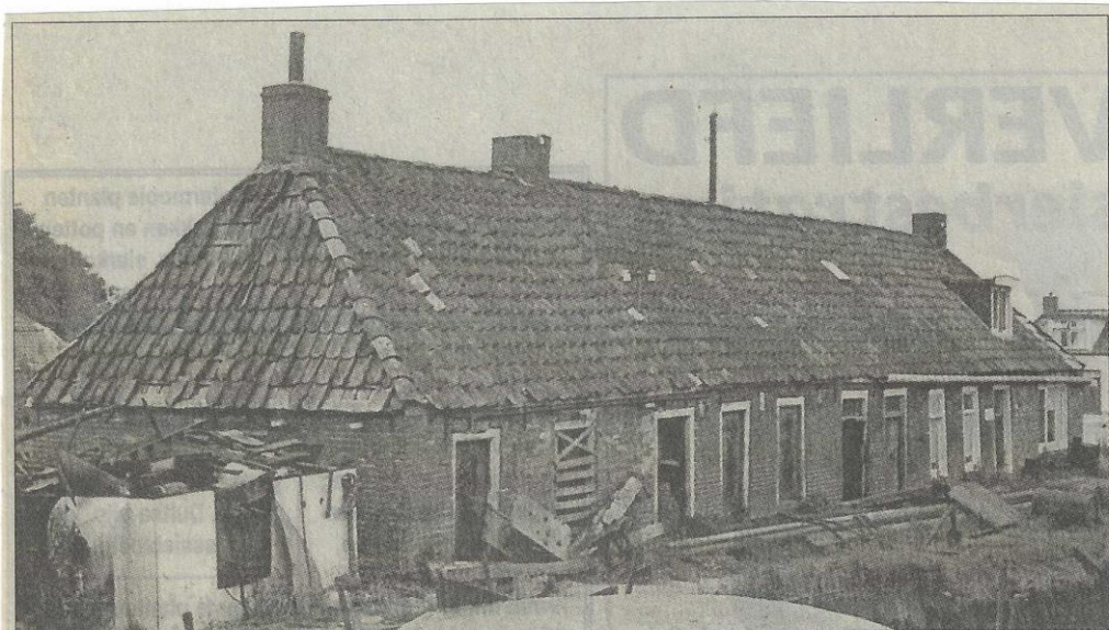
Hellingstraat 12a, 12b en 12c. Afgebroken in juni 1964.