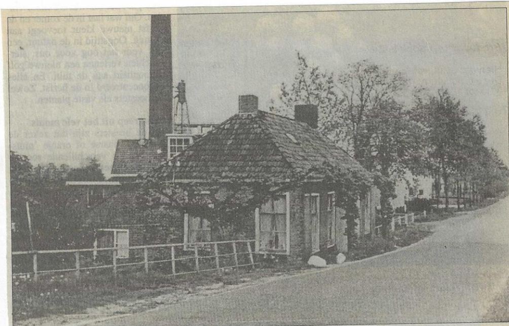
Verlaatsterweg 32, Gerkesklooster in 1965, laatste bewoner P. Bron, eigenaar Rijkswaterstaat.